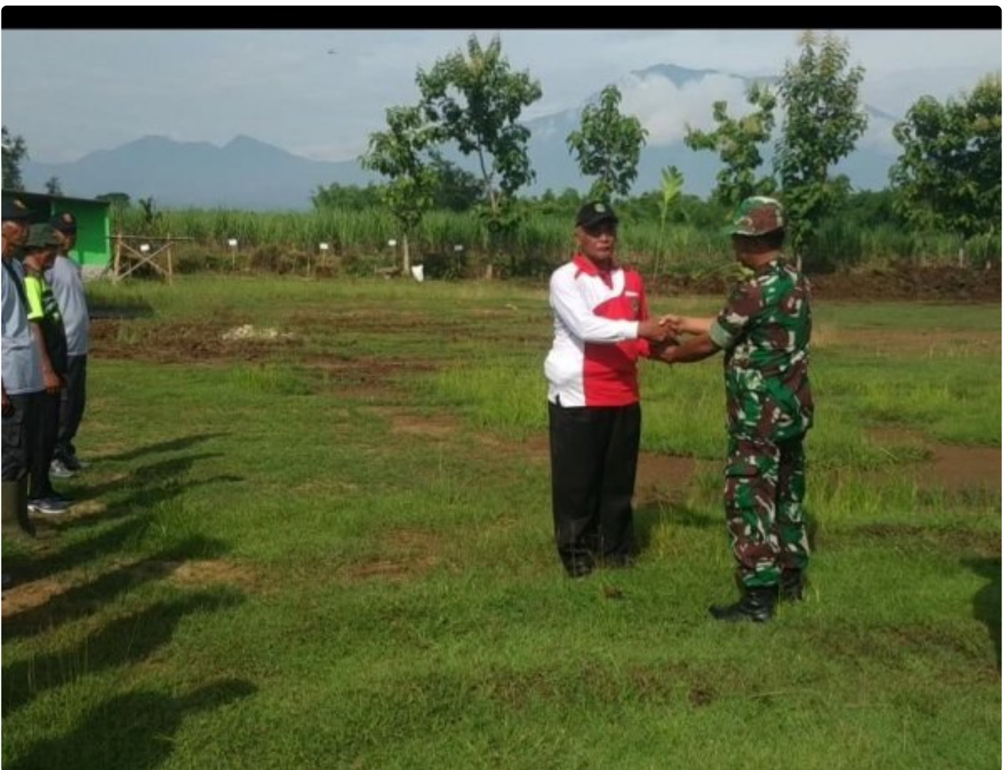
Jaga Kelestarian Alam Kodim 0804/Magetan Tanam 1.950 Bibit Pohon Sukun

Magetan – Sebagai bagian dari upaya menjaga kelestarian lingkungan dan mendukung program penghijauan yang dicanangkan pemerintah, TNI dari Kodim 0804/Magetan bersama pemerintah desa, masyarakat dan pengiat lingkungan