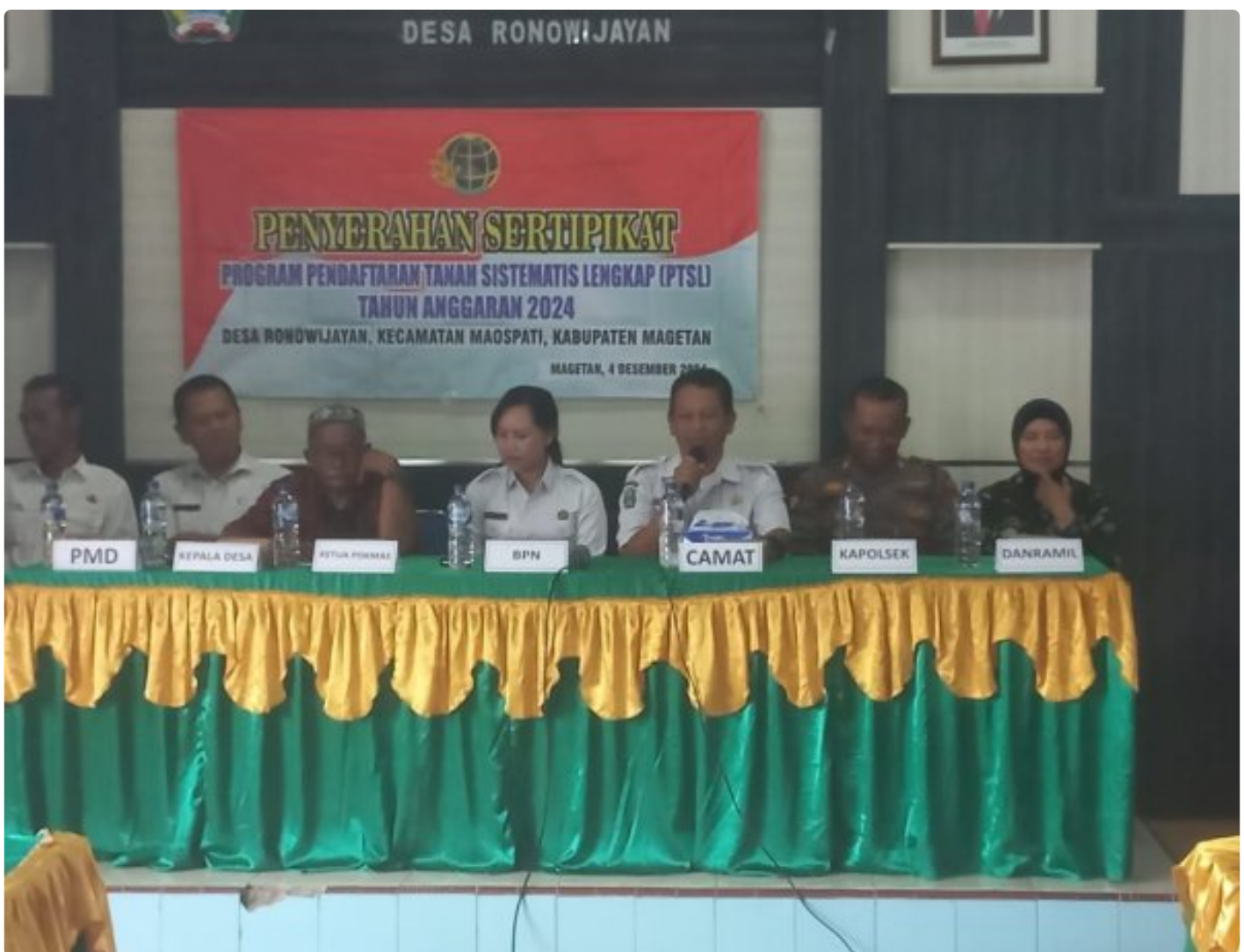
Danramil 0804/06 Maospati Hadiri Penyerahan Sertifikat PTSL Desa Ronowijayan

Magetan. - Bertempat di Balai Desa Ronowijayan, Kecamatan maospati,