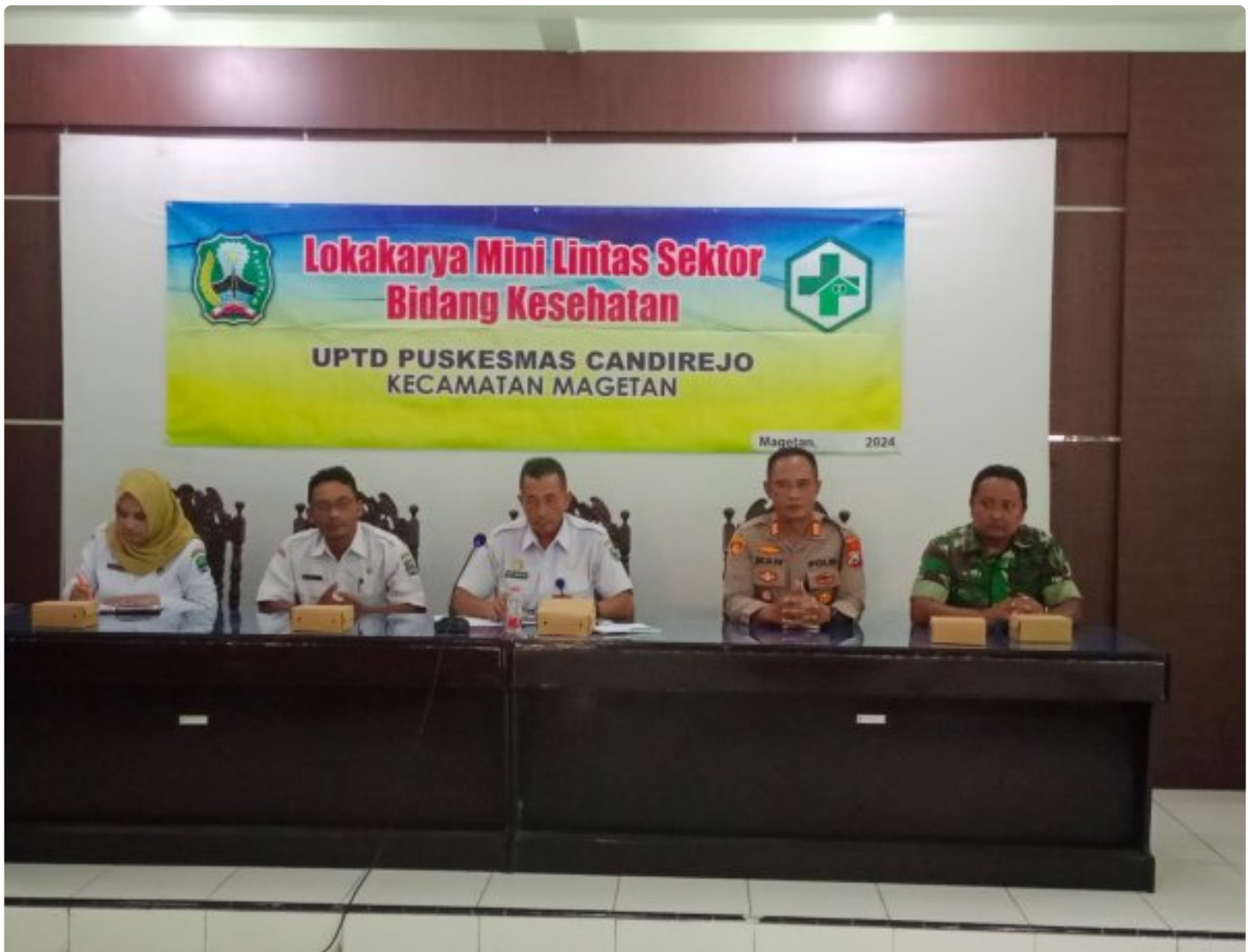
Bati TUUD Koramil 0804/01 Magetan Hadiri Loka Karya Mini Lintas Sektor Tri Bulanan Bidang Kesehatan

MAGETAN. - Bati TUUD Koramil Tipe B 0804/01 Magetan Kodim Magetan Pelda